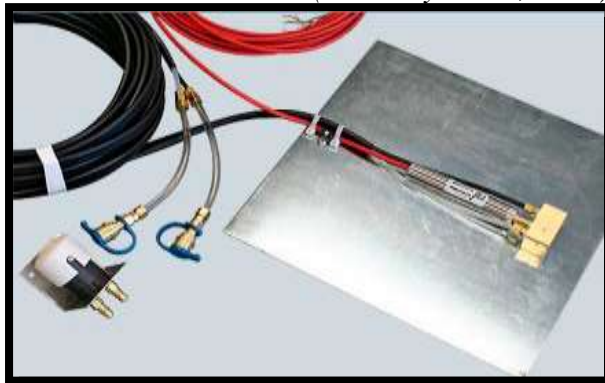
Anexo 4: Celda de asentamiento de cuerda vibrante