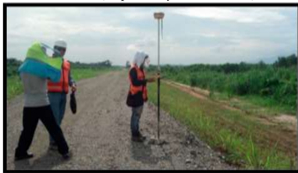
Anexo 3: Medición de asentamiento con GPS diferencial.