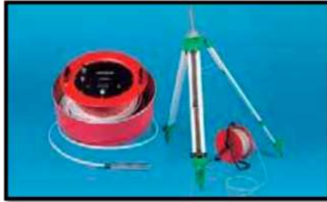
Anexo 5: Sonda Hidrostática de Asientos