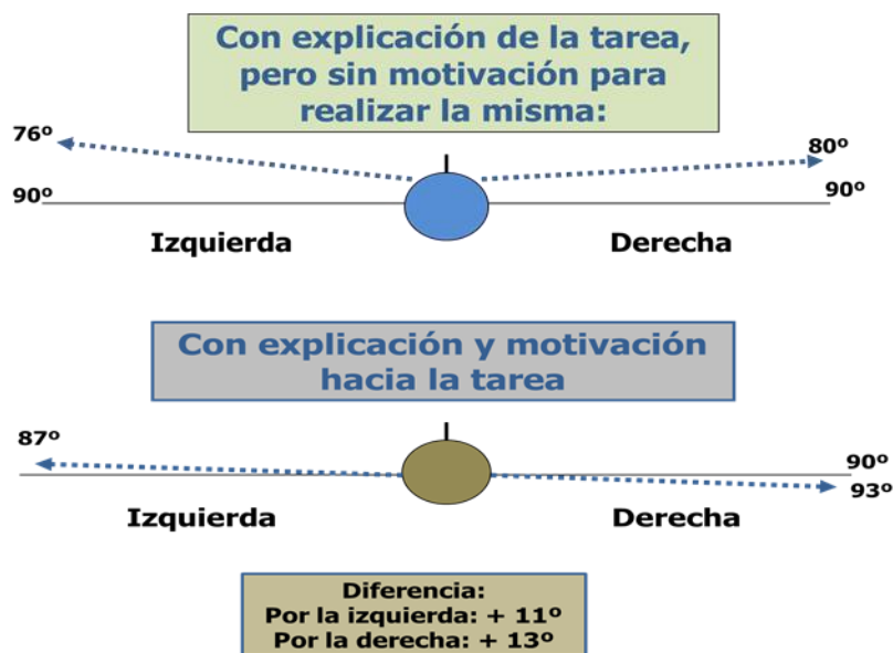
Figura 2. Percepción periférica lateral con y sin motivación hacia el control.

Como se observa, en la figura anterior el hecho de que el entrenador haya motivado a los jugadores para la realización de esta prueba de terreno, explicándoles la importancia que para el Baloncesto tiene que el deportista pueda percibir por sus laterales ampliamente, para así poder defender mejor el balón que posee, captar la posición de compañeros y contrarios en el terreno, etc., manteniendo la dirección de la vista al frente, ejemplifica la importancia de respetar el indicador motivación hacia la tarea .