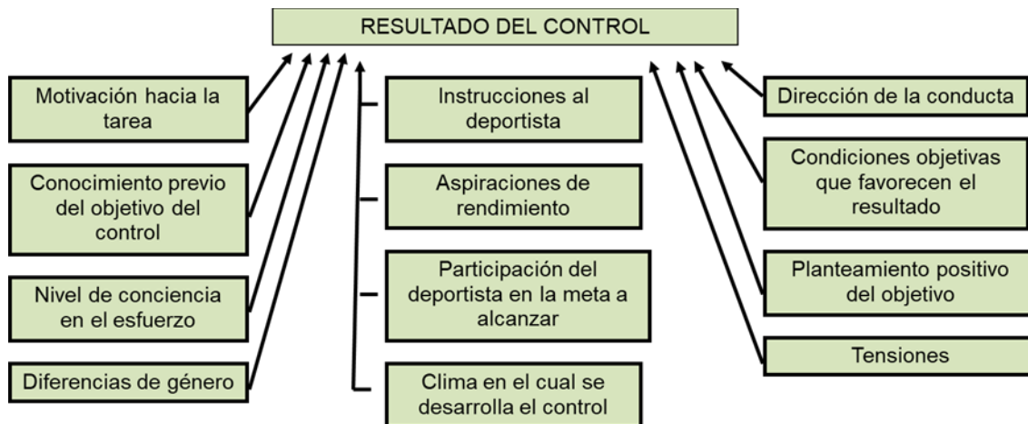
Figura 1. Indicadores psicológicos que más influyen en el resultado del control

Una larga experiencia en el diagnóstico psicológico y en el trabajo en este campo con equipos deportivos conduce a la autora, no solo a precisar la importancia de este fenómeno, sino también a la necesidad de socializarlo, de llamar la atención sobre esta temática. A su juicio, los indicadores más importantes que requieren respetarse, a fin de que los resultados que se alcancen en las mediciones reflejen el verdadero nivel de desarrollo de los sujetos estudiados son los siguientes: